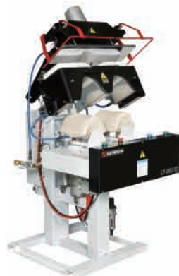
シングルカラーカフス LP-690J-V2